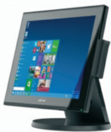
Touchscreen-Kassen-PC „All-In-One“ (Beispiel) inkl. Windows 64-Bit, Win10 IoT, TSE-Hardware-Modul, Speicher: 8GB, Zertifikatslaufzeit 5 Jahre inkl. Kingston Kartenleser, USB

Wir benötigen einige Information über Ihr Kassensystem Bitte per mail an: tanja.ilse@consulting-gmbh.info